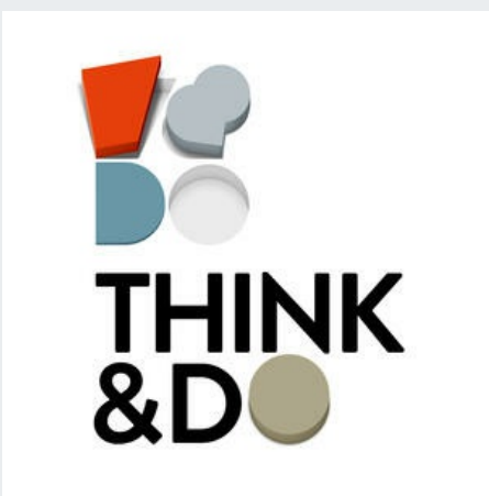
Illustration: Sven Sedivy

Think&Do ist ein Podcast-Angebot des Stifterverbandes. Es bietet Gespräche und Reportagen zu Bildung, Wissenschaft und Innovation. Der Podcast ist in allen wichtigen Podcast-Verzeichnissen gelistet und kann so bequem über das Smartphone abonniert werden.